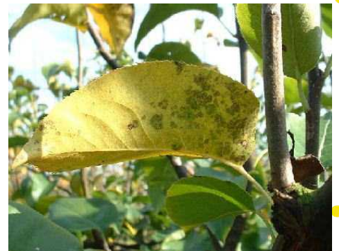
黒星病の秋型病斑

今年黒星病の被害が多かったほ場はもちろんですが、発病程度の少なかったほ場でも油断せずに防除を行い、来年に備えましょう。