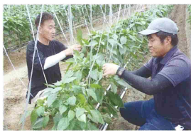
先進農業派遣実習