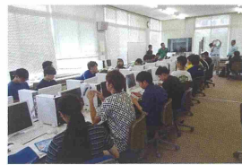
実践を支える理論や知識に関する講義