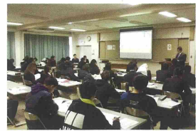
卒業研究実績発表会