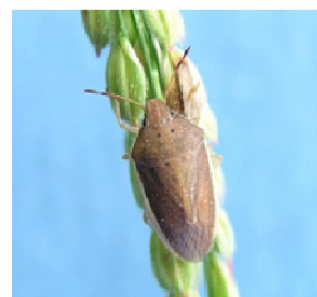
写真3 イネカメムシ(成虫)