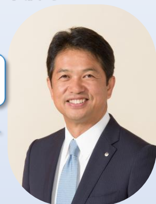
茨城県知事 大井川 和彦