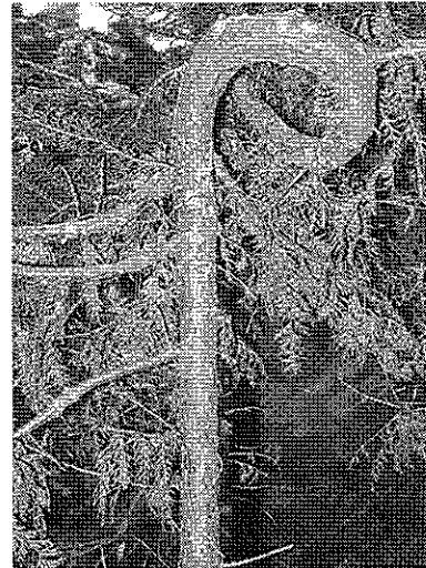
写真2. 罹病後放置され変形した幹