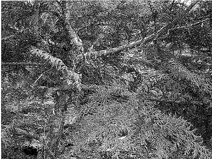
写真1. 幹、小枝からヤニが流出する罹病木