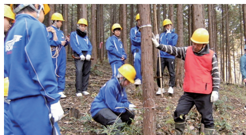
かんぱつたいけん 中学生による間伐体験の様子

また、自然や木に触れあう体験活動を通 して、みなさんに森林の働きや林業の大切 さなどを知ってもらう取り組みをしています。