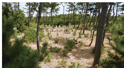
かいがんりん ほ ぜん なえ ぎ しょくさい 海岸林の保全（苗木の植栽）

海岸沿いの松林にクロマツや広葉樹を植 栽するなど、海からの風や砂などから暮ら しを守る海岸林の保全に取り組んでいます。