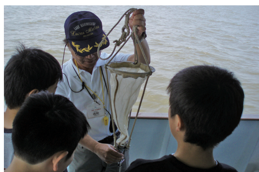
プランクトン観察のようす