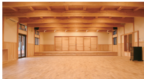
けんちくぶつ もくぞうか 建築物の木造化

また、木をたくさん使うことによって森 林の整備を進めることができるため、建築 物の木造化など、木材の利用拡大に取り組 んでいます。