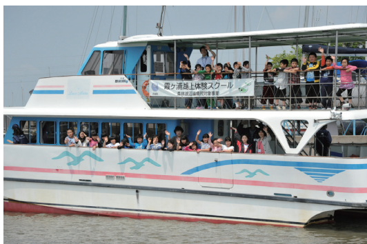
霞ヶ浦湖上体験スクール

小中学生などを対象に、霞ヶ浦において、水をきれいにする大切さを知ってもらうために、霞ヶ浦湖上体験スクールを行っています。遊覧船で実際に湖上に出てプランクトン観察などをする体験学習と、下水処理場などの施設見学を組み合わせ、水環境について学ぶことができます。