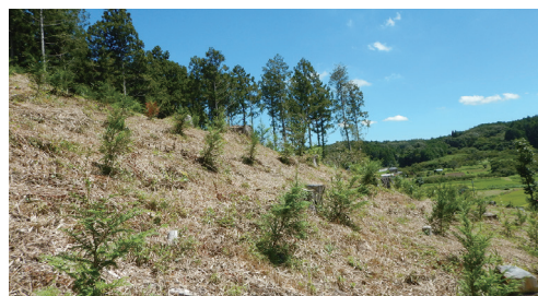
せい び さいぞうりん 森林の整備（再造林）

木を健康に育て、森の働きを保つため、 混み合った木を間引く「間伐」や、木を伐 採した後に再び苗木を植栽する「再造林」 など、森林の整備を進めています。