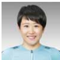
かじはら ゆうみ 梶原 悠未氏

元サッカー選手(いばらき大使) 1976年茨城県日立市生まれ。高校卒業後に鹿島アントラーズに加入し、チームの3冠獲得等の原動力となる。2002FIFAワールドカップでは日本代表に選出され、ベルギー戦でゴールを決めるなどベスト16に貢献する。2015年12月に現役引退。