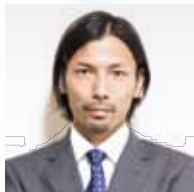
すずき たかゆき 鈴木 隆行氏

元サッカー選手(いばらき大使) 1976年茨城県日立市生まれ。高校卒業後に鹿島アントラーズに加入し、チームの3冠獲得等の原動力となる。2002FIFAワールドカップでは日本代表に選出され、ベルギー戦でゴールを決めるなどベスト16に貢献する。2015年12月に現役引退。