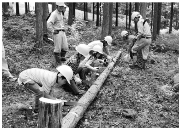
森林・林業体験 みんなで丸太を切ってみよう

森林の働きや重要性などについて広く県民の皆様に理解していただくため、森林づくりや森林環境学習などを行う市町村やボランティア団体等を支援するとともに、森林・林業体験学習を実施しています。