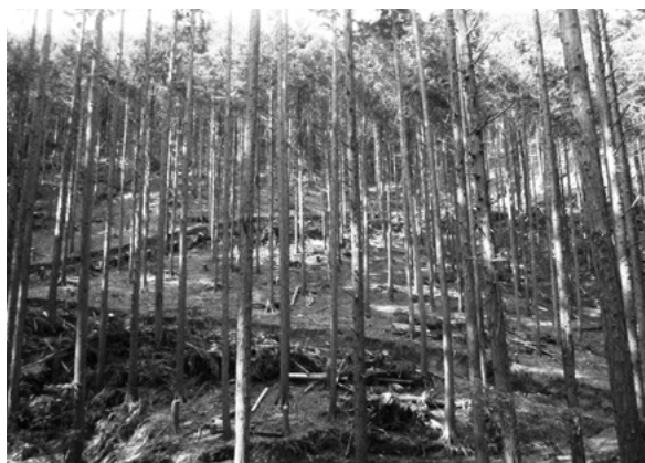
間伐で林内が明るくなった森林