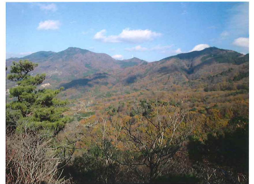
つぼろ台から望む加波山