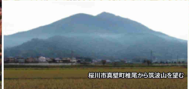
桜川市真壁町椎尾から筑波山を望む

「この地図は、国土地理院長の承認を得て、同院発行の電子地形図25000を複製したものである。(承認番号 平28情復、第1307号)」