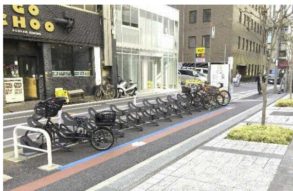
図 7.22 まちなかにおける路上駐輪場の例(東京都)