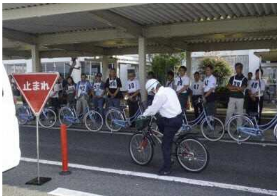
図 7.27 安全指導者講習会