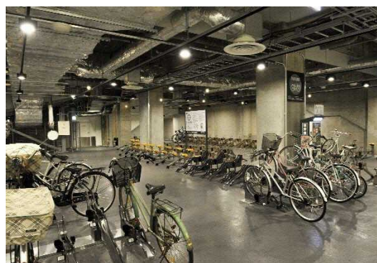
図 7.23 駅ビルの屋内駐輪場(土浦市)