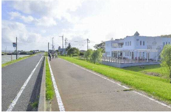
図 7.15 休憩施設 (かすみがうら市交流センター)