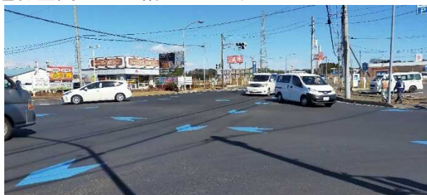
図 7.19 矢羽根の例