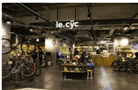
図 7.9 駅直結型のサイクリング拠点施設「りんりんスクエア土浦」(土浦市)