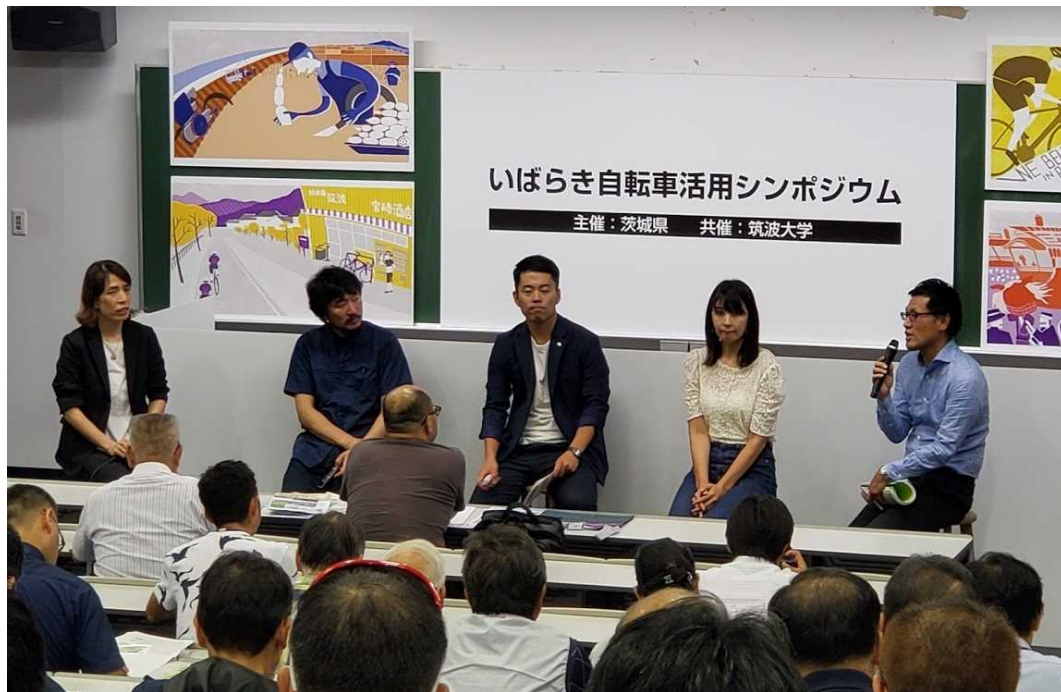
図 7.31 自転車利用促進イベント(いばらき自転車活用シンポジウム)