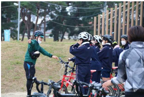
図 7.6 サイクリングを活用した校外学習