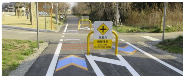
図 7.20 矢羽根・交通安全施設の例(つくば霞ヶ浦りんりんロード)