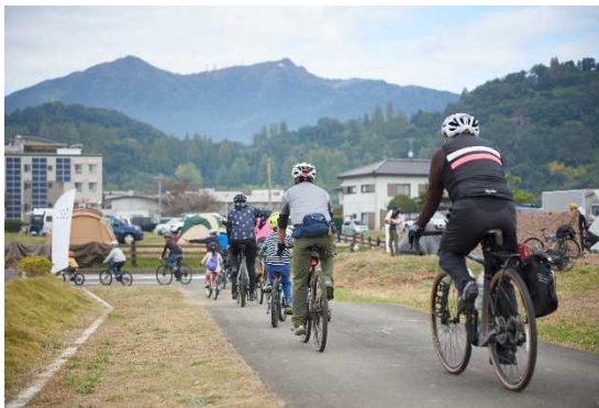
図 7.3 サイクリングイベント バイク&キャンプフェスの模様