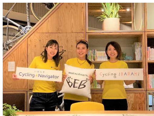
図 7.8 女性やビギナーをターゲットにした情報発信