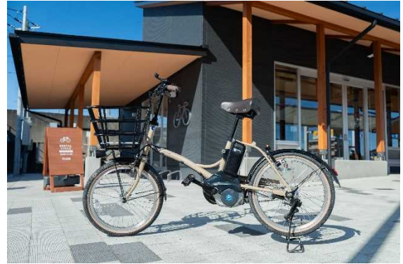
図 7.12 うみまちテラス(大洗町)