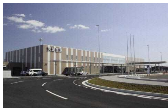
図 7.10 茨城空港(小美玉市)