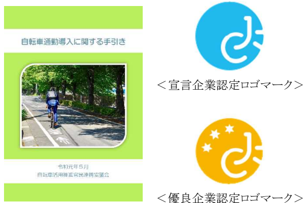
図 7.29 自転車通勤導入に関する手引き （自転車活用推進官民連携協議会）