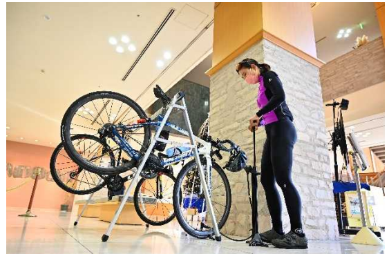
図 7.16 サイクリスト向けの機能を備えた 宿泊施設