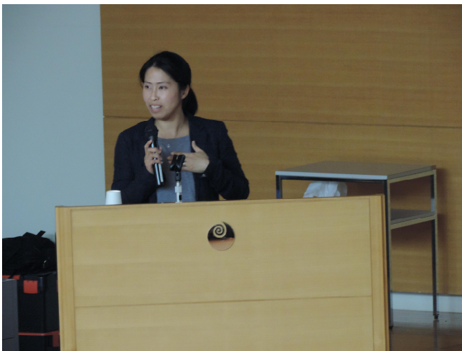
わくわくネットの発表

最後に、事例発表者とのパネルディスカッションを行い、財源や期間が少ないなかで事業を実施した苦労や工夫した点、仲間を集め、ネットワークを広げていくための方法など