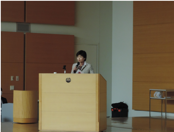
みらいバリューの発表