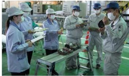
新入社員現場実習風景