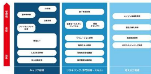
キャリアに応じた豊富な研修制度