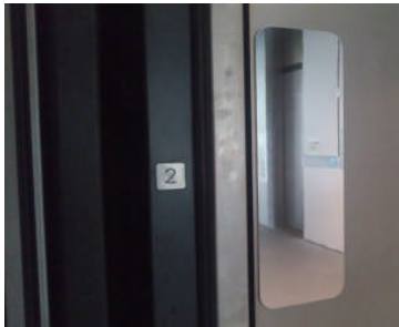
乗り込もうとしている方が見えます

エレベーターを利用しようとする来庁者が、その目前でドアが閉まってしまうのを回避するため、ミラーを設置してはどうかとの提案を受け、今年5月に、安全な利用の確保に重点を置いて運用している身障者用エレベーター(1F・2F)に試行的に導入しました。 エレベーターの内側から、外側の死角が見やすくなったので、乗り込もうとしている方への気遣いがしやすくなったのではないのでしょうか。