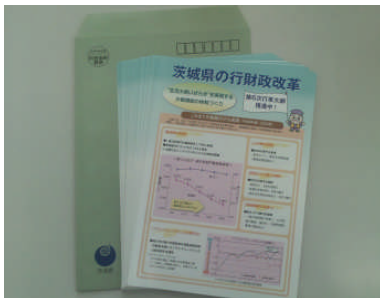
信書以外であれば活用可能(要契約)

信書以外の郵便物を郵送する際には、「ゆうメール」というしくみを活用すると普通郵便より安価で郵送できます。