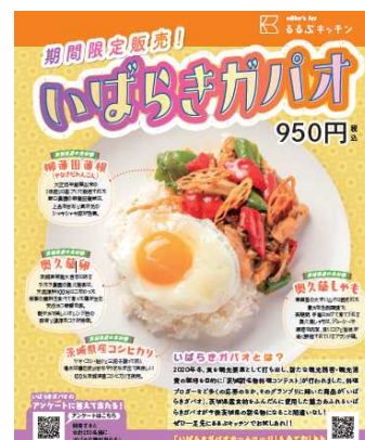
メニューイメージ