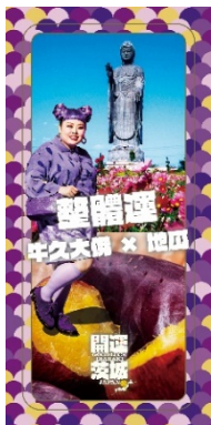
全体運 (牛久大仏 × かんしょ)

茨城県のパワースポット等と食を組み合わせた「開運茨城」の待ち受け画像をウェブサイトからダウンロードできます。茨城にはハッピーがあふれているというメッセージが込められており、待ち受けにすると運気が上がり、あなたにもハッピーが訪れるかも!