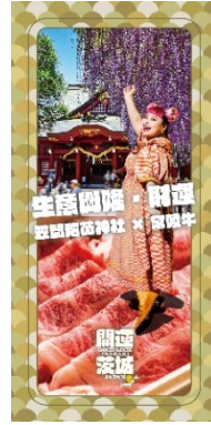
商売繁盛・金運 (笠間稲荷神社 × 常陸牛)