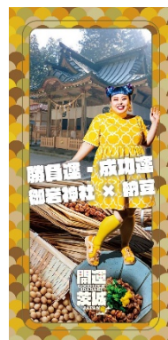
勝負運・成功運 (御岩神社 × 納豆)