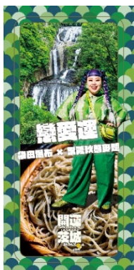
恋愛運 (袋田の滝 × 常陸秋そば)