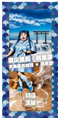
厄除け・健康運 (大洗磯前神社 × 日本酒)