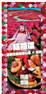
結婚運 (ひたち海浜公園 × はまぐり)