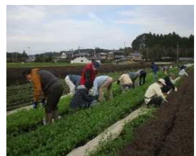
－産地見学会（令和2年度）－