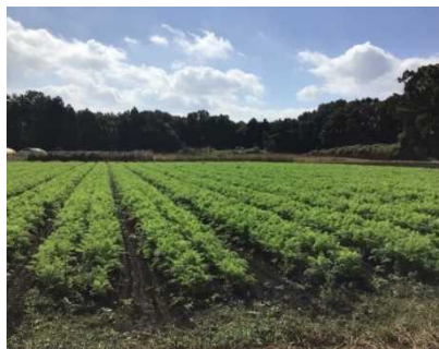
－ニンジン栽培ほ場－

常陸大宮市内に有機農業で新規参入した農業法人。令和元年度「いばらきオーガニックステップアップ事業」を活用して機械を導入、翌年度から営農を開始。現在、有機野菜を常陸大宮市で約5haのほか、筑西市では約30haを作付けし、年間で50品目以上を大手スーパー等に出荷しています。