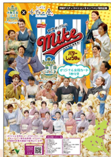
▲販促ポスターデザイン