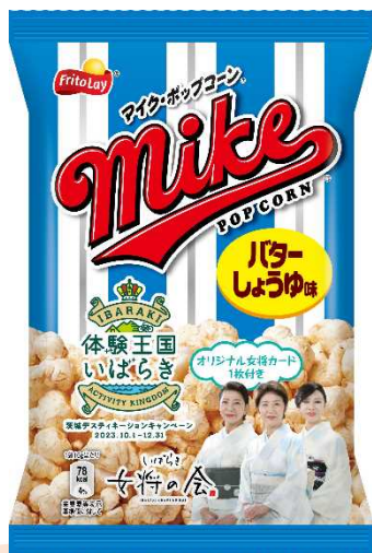
▲パッケージデザイン

10月1日から実施する「茨城デスティネーションキャンペーン(茨城DC)」に 合わせ、昨年の茨城プレDCで好評をいただいた「いばらき女将カード」第2弾企画 として、「いばらき女将の会×ジャパンフリトレ(株)(本社:古河市)」のスペシャルコ ラボによる「いばらき女将カード付きマイクポップコーン」を新発売しますので、貴 社媒体でのご紹介及びご案内をお願いいたします。