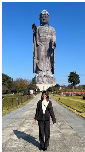
タイ観光客からも人気の牛久大仏