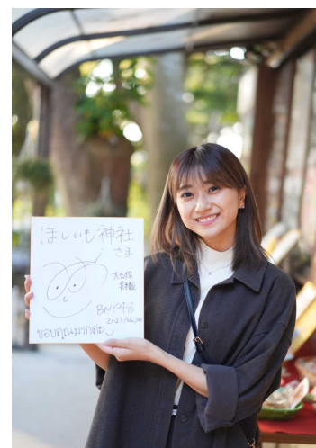
ほしいも神社で色紙にサイン