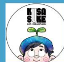
くさすけ氏 X:@kusa_suke021 Instagram:@kusa_suke