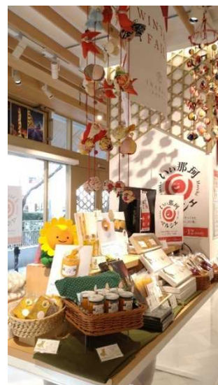
▲前回のイベントの様子