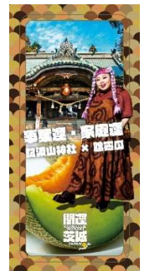
仕事運・家庭運 (筑波山神社 × メロン)