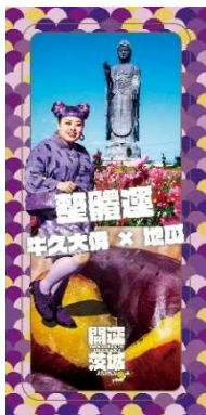
全体運 (牛久大仏 × かんしょ)

茨城県のパワースポット等と食を組み合わせた「開運茨城」の待ち受け画像をウェブサイトからダウンロードできます。茨城にはハッピーがあふれているというメッセージが込められており、待ち受けにすると運氣が上がり、あなたにもハッピーが訪れるかも！