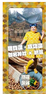
勝負運・成功運 (御岩神社 × 納豆)