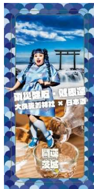
厄除け・健康運 (大洗磯前神社 × 日本酒)