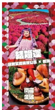
結婚運 (ひたち海浜公園 × はまぐり)