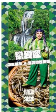
恋愛運 (袋田の滝 × 常陸秋そば)