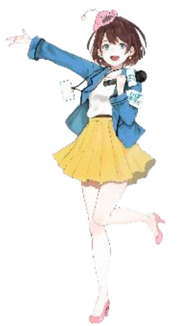
茨城県公認Vtuber 茨ひより