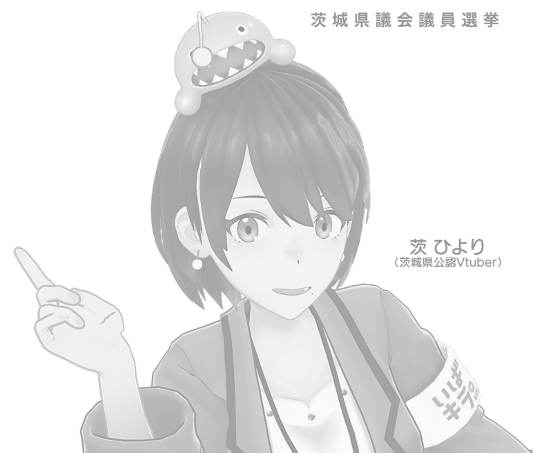
茨ひより (茨城県公認Utuber)