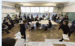
芸術・文化の振興