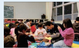
働く親のための保育等人材確保