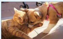
犬猫殺処分ゼロを維持する取組