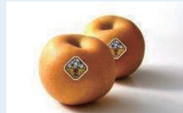
農林水産物のブランド化