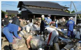
災害ボランティア活動の支援