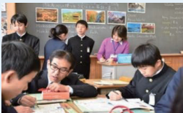
子どもたちの教育環境の充実