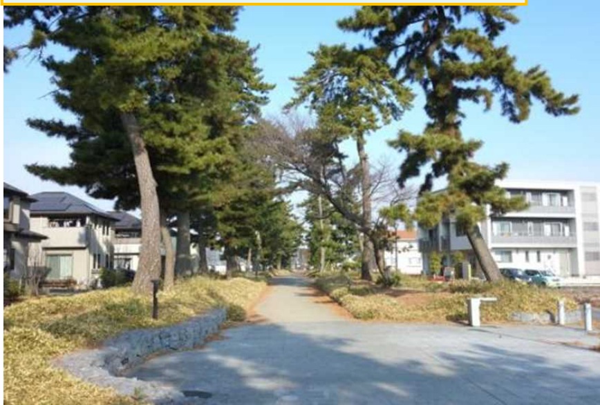
電線地中化により災害に強く、美しい景観を実現