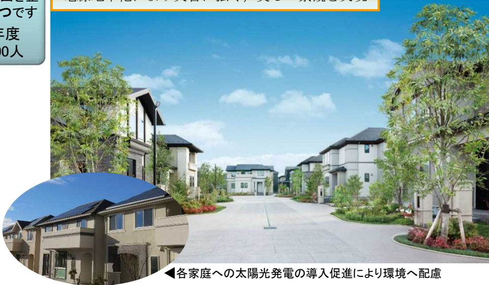
◀各家庭への太陽光発電の導入促進により環境へ配慮