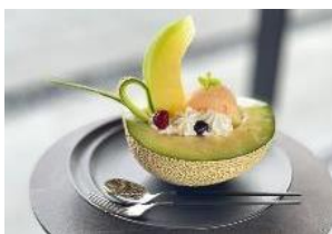
▲完熟メロンの半カットパフェ 2,618円(税込)