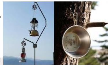
「the yuria」 Z works.