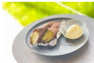
▲まるごと焼き芋 パニアイスを添えて 858円(税込)