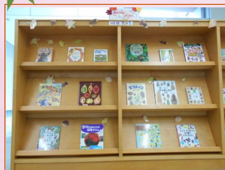
(落ち葉・木の実・秋の本コーナー)